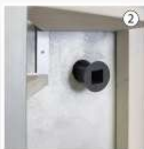
Posizionare la scatola da incasso all'interno del foro