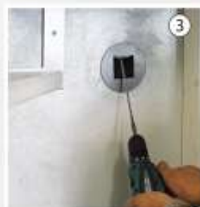
Eeguire i fori per l'inserimento delle viti di ancoraggio