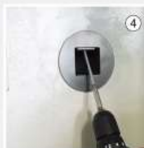
Inserire le viti di ancoraggio