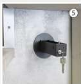
Inserire la cassetta contenitrice