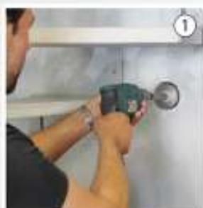
Praticare un foro con apposita punta a tazza

A tale proposito si possono seguire i passaggi di installazione come nelle immagini seguenti o visionando il video dedicato.