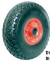
Disco in lamiera