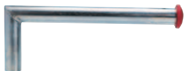
TUBO A per golfari GP